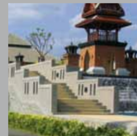
HOTEL MERIDIEN KAO LAC